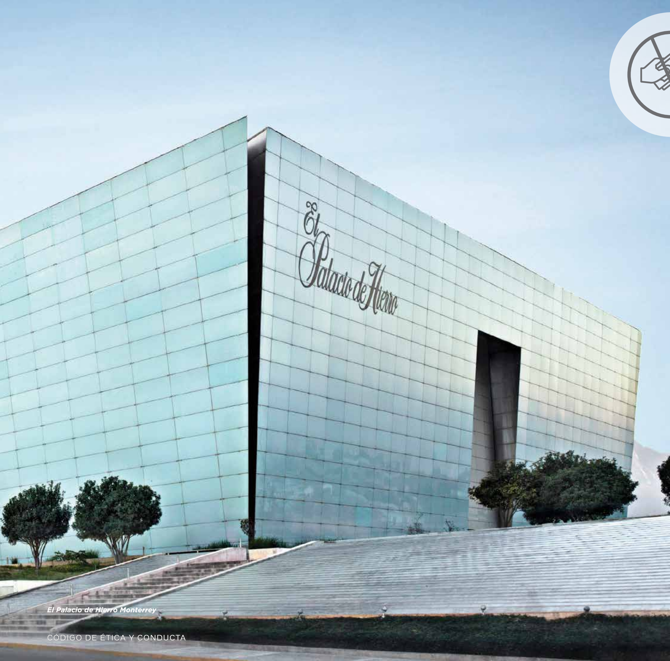
El Palacio de Hierro Monterrey