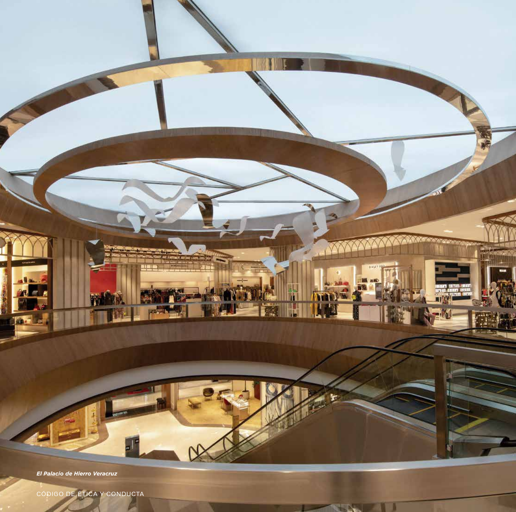
El Palacio de Hierro Veracruz