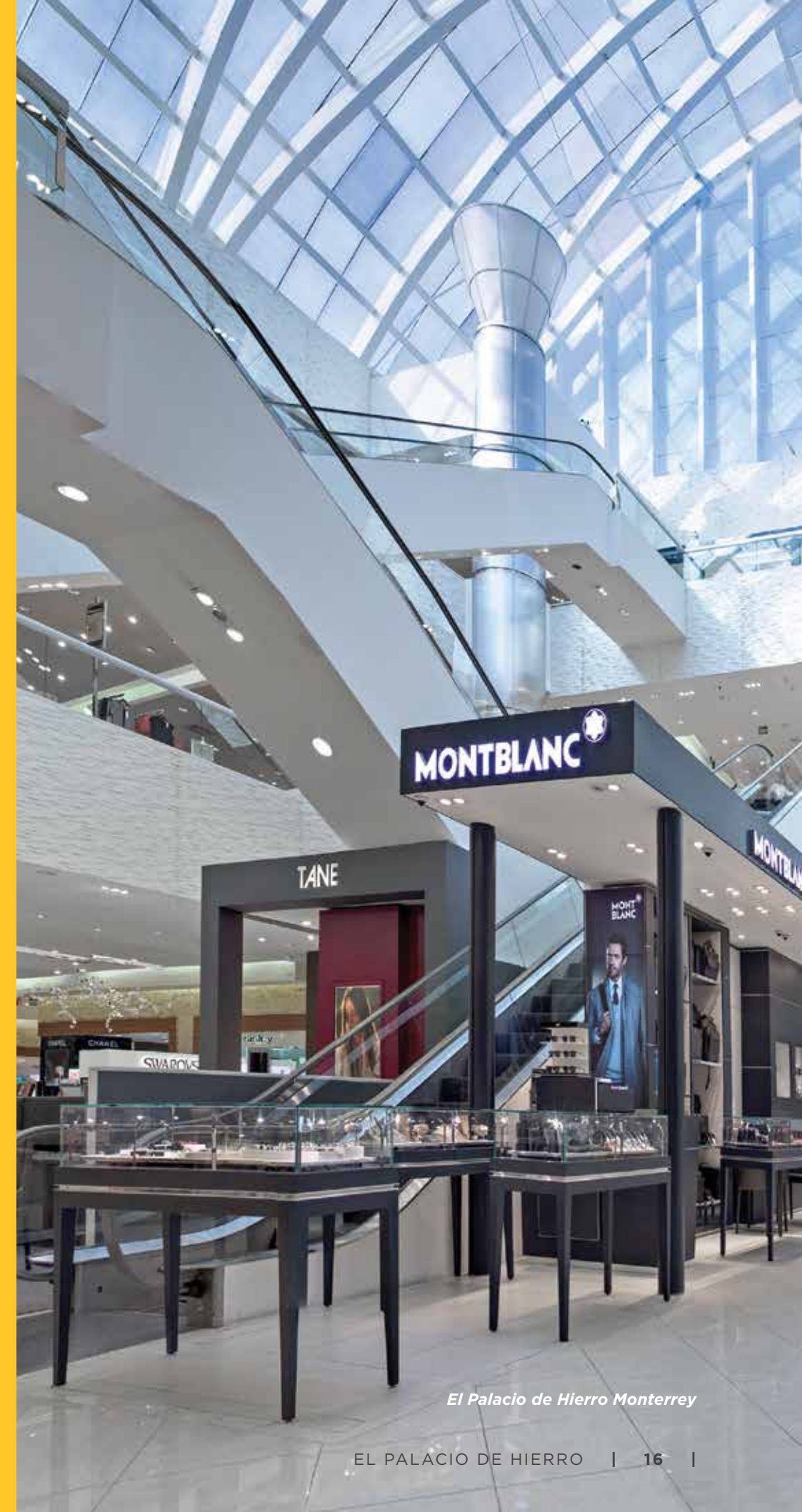
El Palacio de Hierro Monterrey

Se espera que los Terceros asuman el compromiso de proteger los derechos humanos y laborales de su personal, incluyendo el tratar a toda persona con dignidad y respeto, sin discriminar por razones de origen étnico, nacionalidad, género, edad, discapacidades, condición social o económica, condiciones de salud, religión, orientación sexual, estado civil, afiliación sindical o cualquier otra acción que atente contra la dignidad humana y tenga por objeto anular o menoscabar los derechos y libertades de las personas. Todo lo anterior deberá llevarse a cabo a través de acciones encaminadas a: