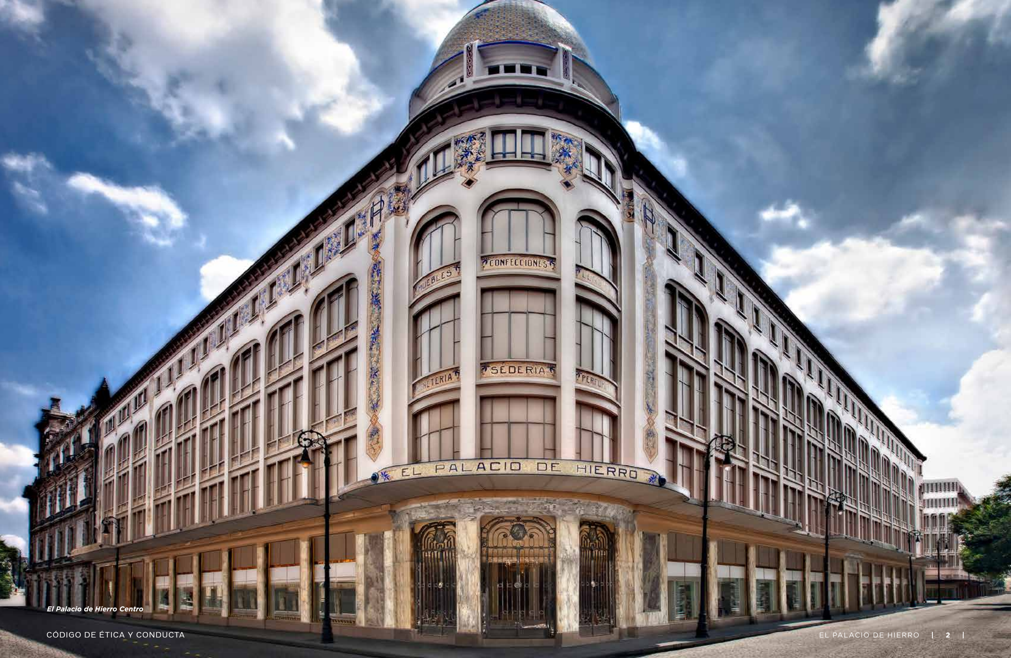
El Palacio de Hierro Centro