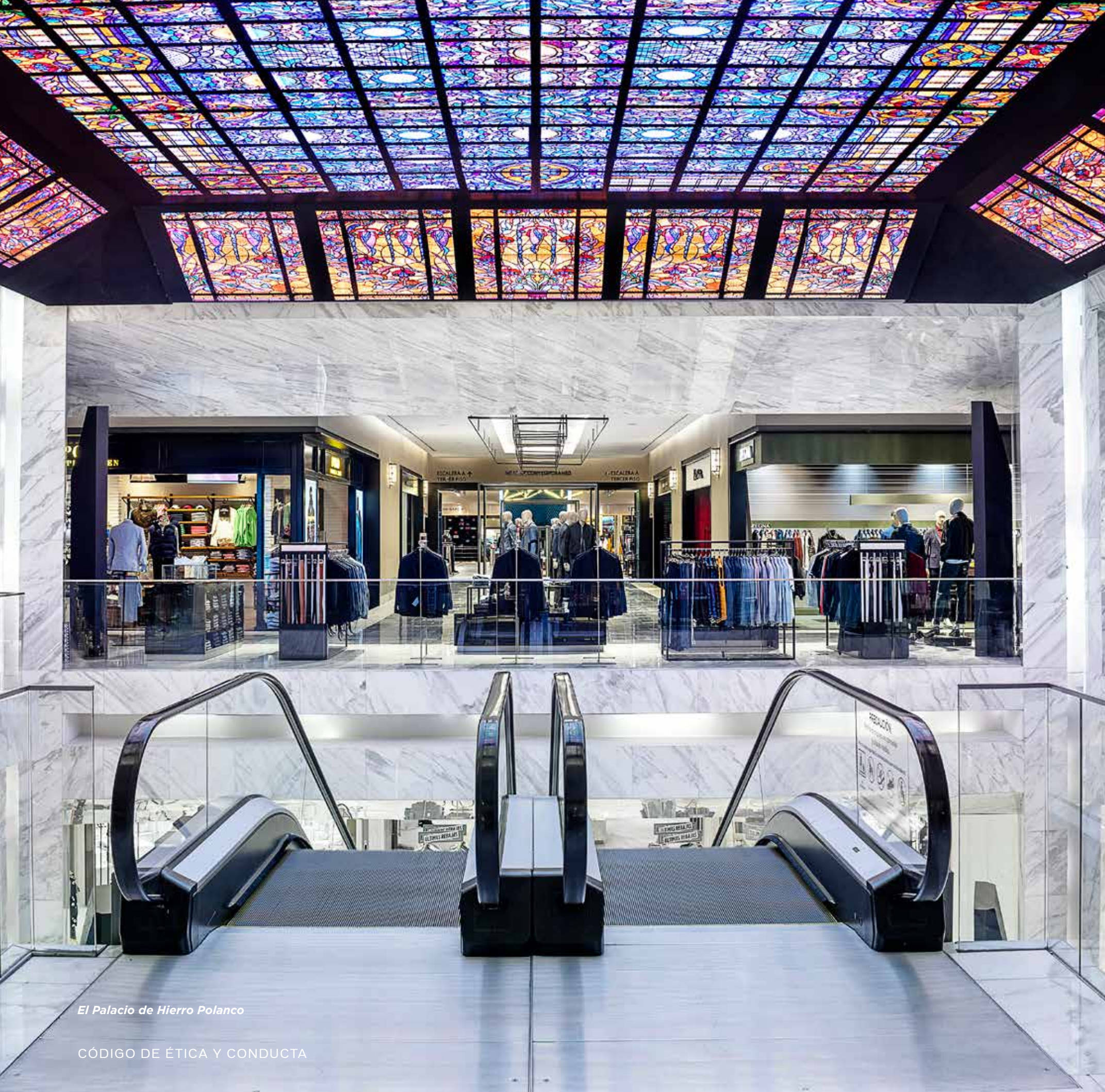
El Palacio de Hierro Polanco

Los comportamientos mínimos esperados por parte de los Terceros son: