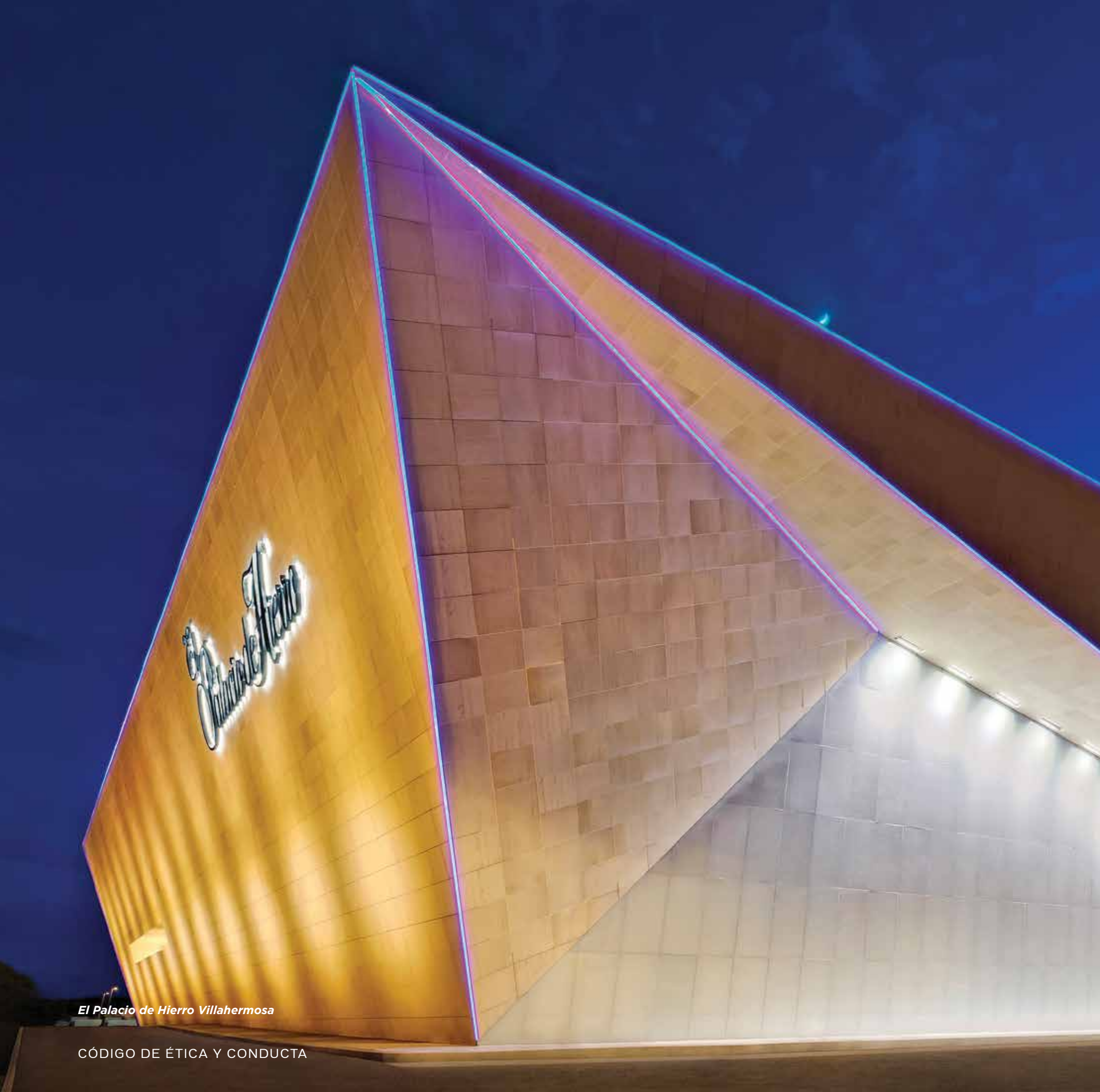
El Palacio de Hierro Villahermosa